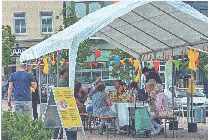
Anregende Gespräche gab es zum Bürgerbrunch am 17. Juni 2023 auf dem Wilhelm-Wunderlich-Platz.